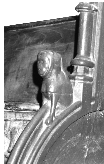
Stalle de Boquého (détail)